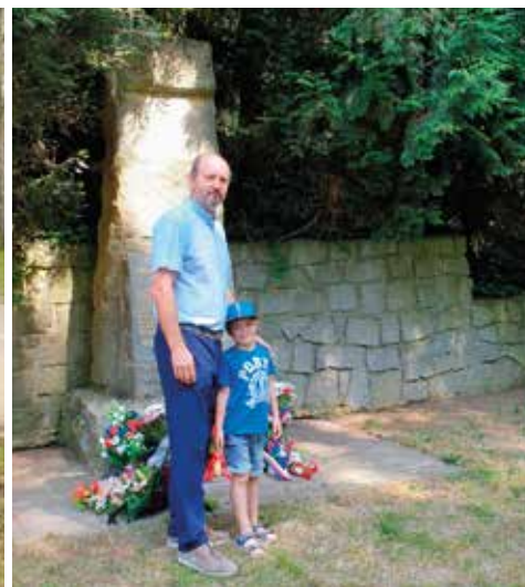
Uctění památky obětí Heydrichiády se uskutečnilo dne 19. 6. v místě bývalého popraviště.