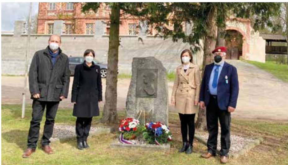
Připomínka 76. výročí konce 2. světové války se uskutečnila 6. 5. za přítomnosti hejtmanky Plzeňského kraje Ilony Mauritzové.