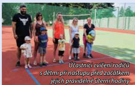
Účastníci cvičení rodičů s dětmi při nástupu před začátkem jejich pravidelné úterní hodiny

Máme za sebou první měsíc fungování nového sportovního areálu. První polovina května nebyla kvůli počasí sportování úplně