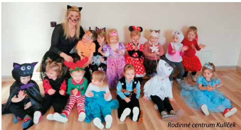
Rodinné centrum Kulíček

V obci Vejprnice působí celá řada sportovních či zájmových spolků, do jejichž aktivit se zapojují občané naší obce a to už od batolat až po občany dříve narozené, naše seniory. Každoročně vypisuje Rada obce dotační program podpory tělovýchovy, sportu a zájmové činnosti v obci Vejprnice, jehož cílem je podpořit právě aktivity jednotlivých spolků, které nabízejí možnosti k využití volného času vejprnickým občanům. V letošním roce podalo do programu žádost celkem 12 subjektů o celkovou finanční podporu ve výši 1,2 mil. Kč a na květnovém jednání Zastupitelstvo obce schválilo rozdělení dotačních finančních prostředků ve výši 940 tis. Kč následovně: