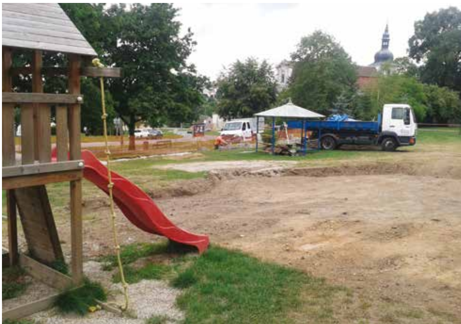
Bez dotačního příspěvku se neobešla ani rekonstrukce oplocení a zahrady ZŠ.

Výkonná rada rozhodla realizovat přijatá opatření v Integrovaném regionálním operačním programu (IROP), Operačním programu Zaměstnanost (OPZ) a Programu rozvoje venkova (PRV). Navíc bude provádět animaci škol a pomáhat při zpracování tzv. šablon v rámci OP VVV (Výzkum, vývoj a vzdělávání).