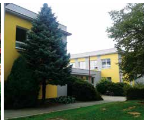
Tento záběr patří definitivně k historii školy