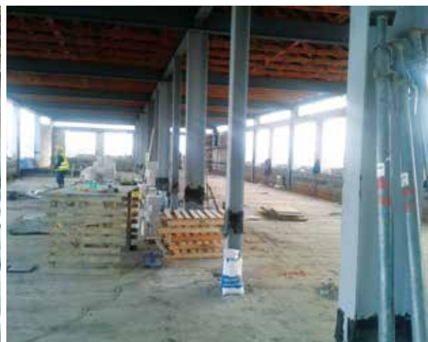
... na konci čistý prostor pro vytvoření příček 2. patra