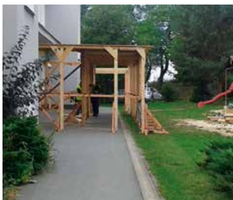
Přestavba si vyžádala i vytvoření nouzových vstupů do školy.