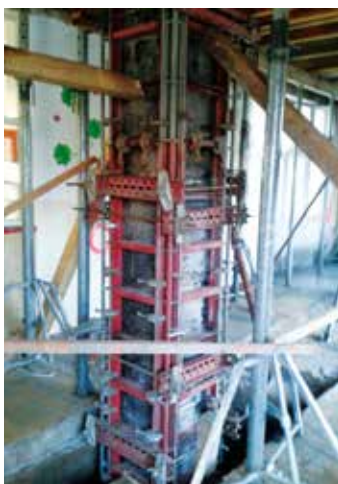
Na počátku byly nutné výztuhy ...