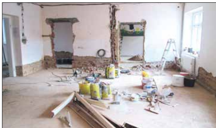
V knihovně v současné době probíhá rozsáhlá rekonstrukce.