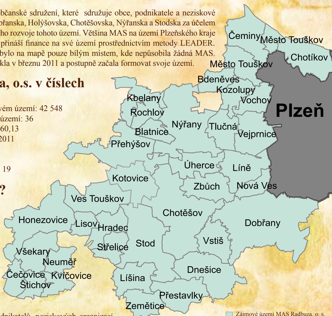
■ Zájmové území MAS Radbuza, o. s.

Tvoří je tedy zástupci obcí, místních podnikatelů, neziskových organizací a aktivní občané. Zástupci nestátních a nesamosprávních subjektů musí tvořit více než 50 % členské základny.