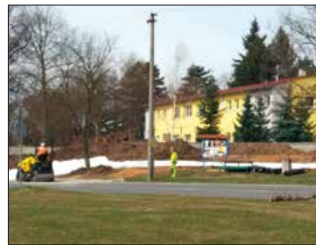
Demolici předcházela úprava příjezdových ploch.

Přípravné práce na vybudování nové tělocvičny v areálu ZŠ nabraly v tomto měsíci vysoké obrátky. Stávající tělocvična byla, jak jste si jistě všimli, zdemolována. Základové poměry jsou v místní tělocvičně nestabilní, proto budou v současné době prováděny vrty a betonovány základové piloty. Následovat bude vlastní hrubá stavba. „Věřím, že se vše podaří realizovat tak, abychom začátkem školního roku mohli funkční tělocvičnu dětem, ale i sportující veřejnosti předat k užívání“ dodává starosta Karpíšek.