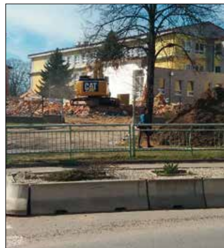
Ze všeho zbyl jen krček.