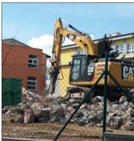
Ve finále došlo na pikování základu.