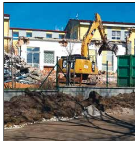
... a že jí chutnalo.