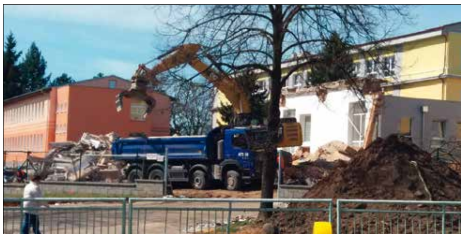
Jedna Tatra za druhou odvážela „pozůstatky“ tělocvičny.