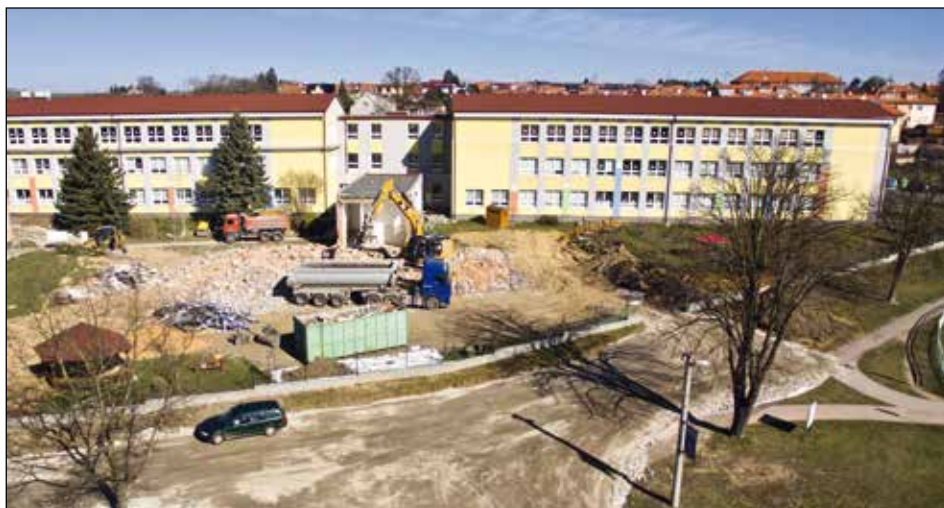
Celé staveniště z pohledu dronu.