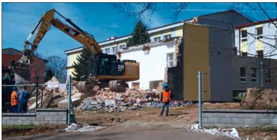
Během dvou dnů zvládla „hladová“ lžice bagru strhnout vše, co jí stálo v cestě...