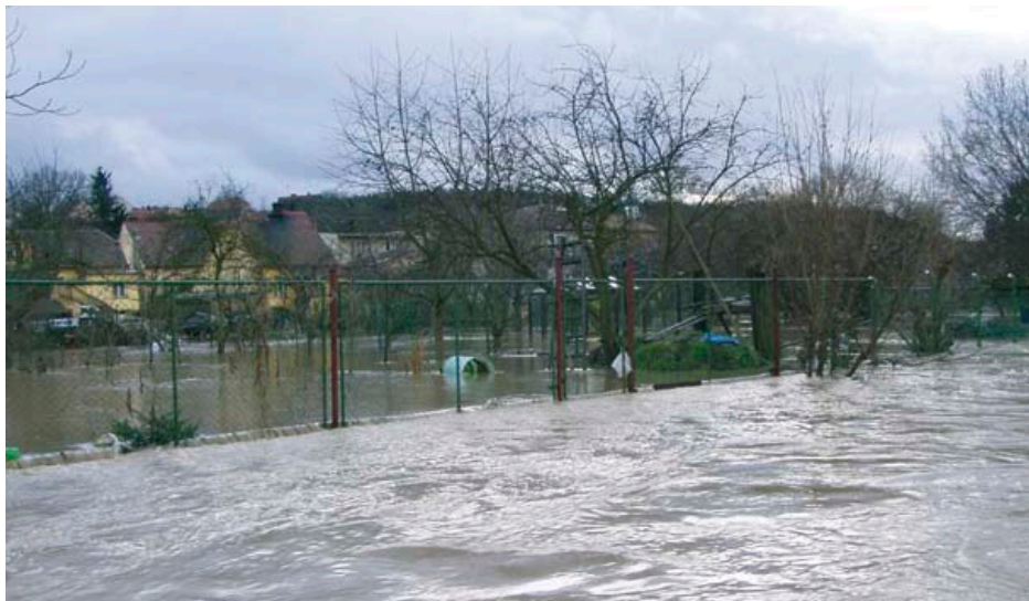
Letošní záplavy se ani trochu nepřiblížily rozsahu záplav v roce 2002. Na obrázku se můžete sami přesvědčit, jak tehdy vypadal střed naší obce.

Projekt významně navazuje na před třemi léty zahájenou modernizaci technického vybavení tříd a odborných učeben pro výuku studentů a řadí naši školu na přední místa v regionu.