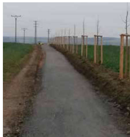
Pohled k Vochovu z Hornické ulice.